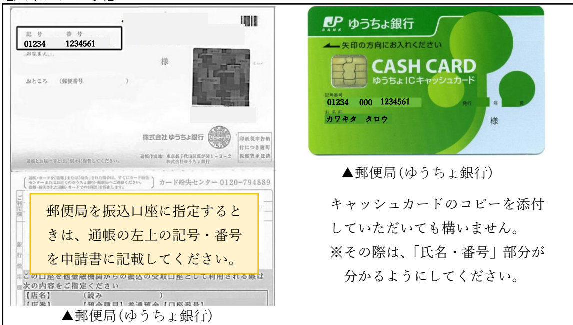
▲郵便局(ゆうちょ銀行)

キャッシュカードのコピーを添付していただいても構いません。 ※その際は、「氏名・番号」部分が分かるようにしてください。