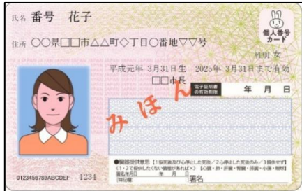
▲マイナンバーカード