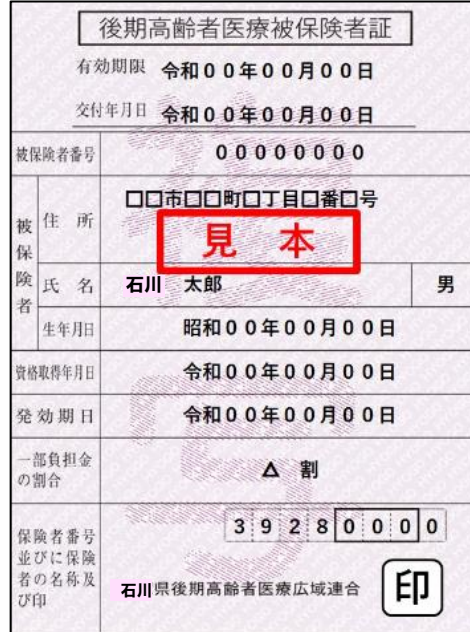
▲後期高齢者医療保険証